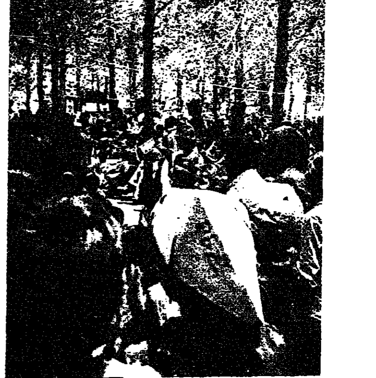
حفلة يوم اولياء الامور لجمع الطلاب في المخيم

وحضيف في حضيض ، اما ارواحهم غرقت على الله ، وقبضها على فرائيل ، لا بداعها في جنات التسليم او اعماق الجحيم هم في حركة مستمرة ، يروحون ويجيئون ويسرعون ويبطئون ، ولكن ماذا استفاد العالم وماذا استفادت البشرية من رواجهم وعمومهم ، اذا كانت الطاقة البدنية تهدر على جمع الاموال وتكديسها ونساقها ونفوسهم على مذبح الشهوات والجهد والفضائل ؟ .. او هل نسوم هذا النهج حياة ؟ .. ان هو الاصلية او لعبة يلعبها الاولاد الصغار بالمقارنة مع تلك النهج الذي تدم الروح فيه الجسد ولا يلاما بكل اخر ، ذلك النهج الذي ينميه اناس يتفكرون ارواحهم ونفوسهم ، واوراح ونفوس اباؤهم بالكتب والقصص السيرة الذاتية والنشاطات الهادفة التي تعود بالنفع على قلوبهم وشعبهم والتي تترك بصمات ثابتة على صفحات البشرية التي تنير الاميال والاجراوات تنفيق اقدارها وتغير الافكار ولا تترك انتباهها للثبات الزائل .